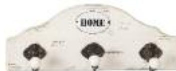
Drewno, metal i ceramika dekorja.pl .49 zł