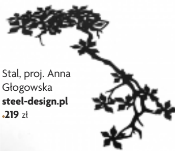
Stal, proj. Anna Głogowska steel-design.pl .219 zł