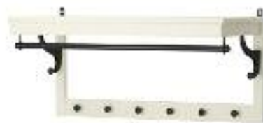
Drewno i lakierowana stal IKEA .159,99 zł