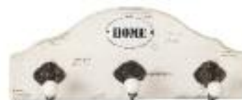
Drewno, metal i ceramika dekorja.pl .49 zł